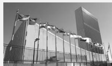
The United Nations Building in New York

1 The United States of America maintains diplomatic relations with approximately 180 states; an ambassador 2 operates in most of the American embassies in these countries as the personal representative of the president.