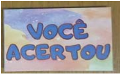
Quadro 1 - orientações gerais do jogo FATO ou FAKE

O jogo FATO ou FAKE foi aplicado conforme as orientações gerais do FATO ou FAKE, descritas no Quadro 1.