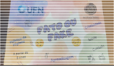
Quadro 1 - orientações gerais do jogo FATO ou FAKE

O jogo FATO ou FAKE foi aplicado conforme as orientações gerais do FATO ou FAKE, descritas no Quadro 1.