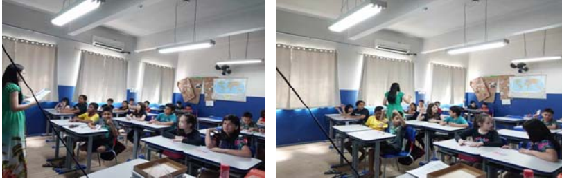
Quadro 4 - resultados da aplicação do jogo FATO ou FAKE.