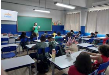
Quadro 4 - resultados da aplicação do jogo FATO ou FAKE.