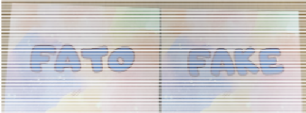
Quadro 1 - orientações gerais do jogo FATO ou FAKE

O jogo FATO ou FAKE foi aplicado conforme as orientações gerais do FATO ou FAKE, descritas no Quadro 1.